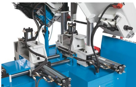
Dispositif de serrage de faisceaux pour la coupe en longueur de paquets de matériels