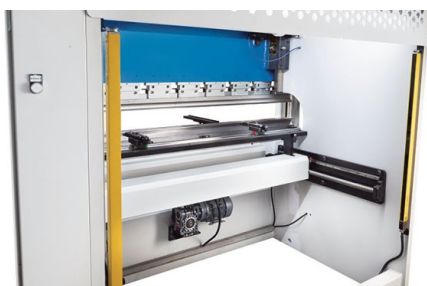
Strona tylna jest zabezpieczona kurtynami świetlnymi