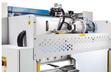
Agregat hydrauliczny znajduje się na górze na maszynie i zapewnia dodatkową przestrzeń do gięcia