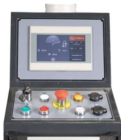
Intuicyjne sterowanie na dużym ekranie dotykowym z trzema trybami pracy: ręcznym / półautomatycznym / automatycznym