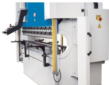
Duży wysięg i wąski stół, aby zapewnić dużo wolnej przestrzeni do złożonego gięcia