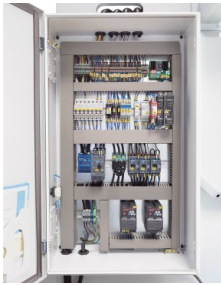
Hochwertige Komponenten garantieren zuverlässige Funktionen