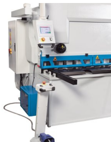
CybTouch 8 G ist die leistungsstarke Ergänzung für hochwertige Tafelscheren