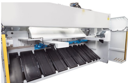
Pomocí volitelného, pneumaticky ovládaného přípravku na přidržování plechu lze i tenké plechy přesně umístit na zadní doraz