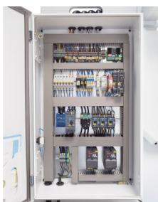
Vysoce kvalitní komponenty zaručují spolehlivé funkce