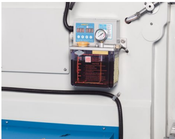
Die automatische Zentralschmierung reduziert den Wartungsaufwand