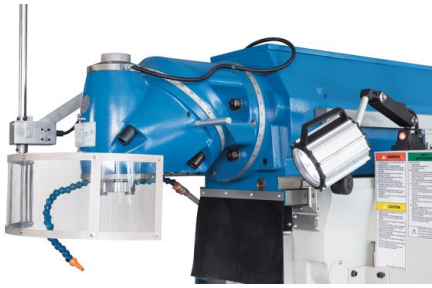
Der Universalfräskopf lässt sich in jedem Winkel einstellen