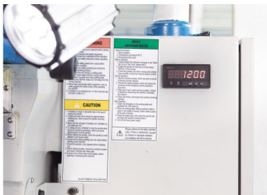
Число оборотов плавно регулируется в большом диапазоне