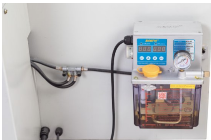
La lubricación continua de precisión minimiza la fricción y el desgaste de las piezas móviles y aumenta la vida útil de la máquina