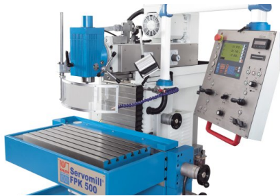
Una gran mesa de trabajo y largos recorridos proporcionan la máxima versatilidad