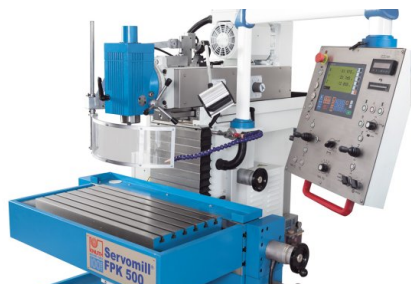
La grande table de travail et les longues courses d'usinage permettent de nombreuses possibilités d'utilisation