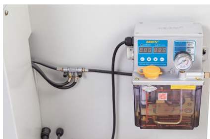
La lubrification continue et précise minimise les frottements et l'usure des pièces mobiles et augmente la durée de vie de la machine