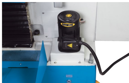
Le circuit de refroidissement intégré optimise le processus d'usinage, augmente la durée de vie des outils et améliore la qualité de surface des pièces