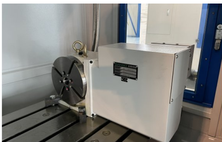
Делительный аппарат типа DR-170 с зажимным столом 210 мм