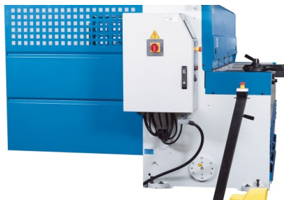
Die gesamte Maschinenverkleidung bietet höchste Sicherheit, ist praxisgerecht gestaltet und hochwertig verarbeitet