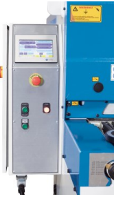
MONITOUCH Human Machine Interface (HMI)-Bedienpanel von Fuji Electric