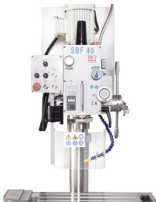
Přehledný obslužný panel a digitální zobrazení hloubky