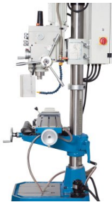
Для сверления и фрезеровки