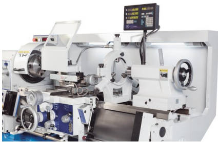
Stabilne podtrzymki seryjnie, ilustracja z opcjonalnymi akcesoriami