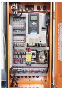
Płynnie regulowana prędkość obrotowa wrzeciona z inwerterem Yaskawa