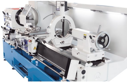
Люнет с большим диаметром зажима входит в стандартную комплектацию; на иллюстрации — с опциональным оснащением