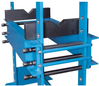
Stół jest mocowany w portalu za pomocą 4 masywnych sworzni bezpieczeństwa