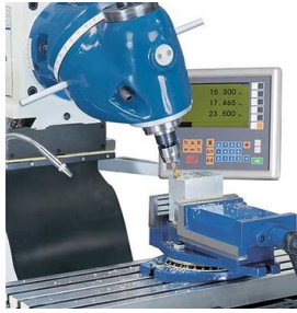
El cabezal de corte gira en 2 niveles